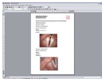
Berichte und Ausdrücke