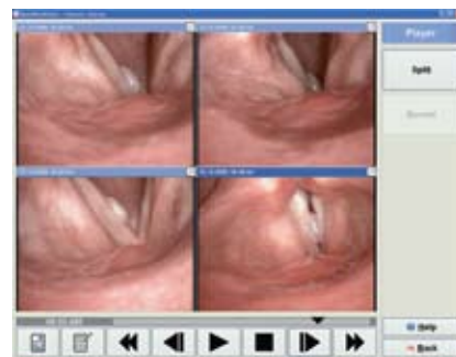
Aufzeichnung, Einzelbilder, Bearbeitung

Einsteigerversion: leistungsfähige Funktionen für Aufzeichnung, Wiedergabe und Archivierung von Videos oder Einzelbildern