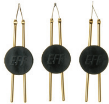
A E P

09-508-D10 09-510-D10 09-504-D10 09-501-D10 09-505-D10