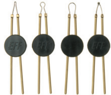
A C D E

09-201-D10 09-203-D10 09-204-D10 09-205-D10