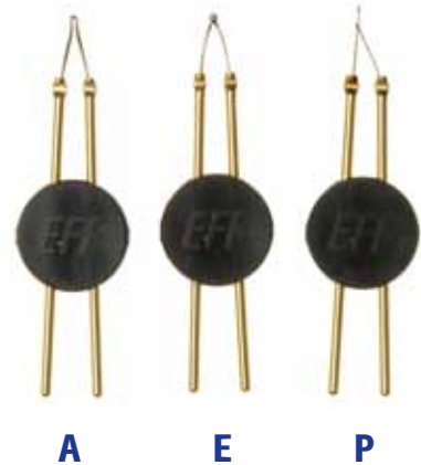
A E P 09-508-D10 09-510-D10 09-504-D10 09-501-D10 09-505-D10