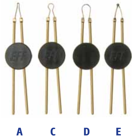
A C D E 09-201-D10 09-203-D10 09-204-D10 09-205-D10