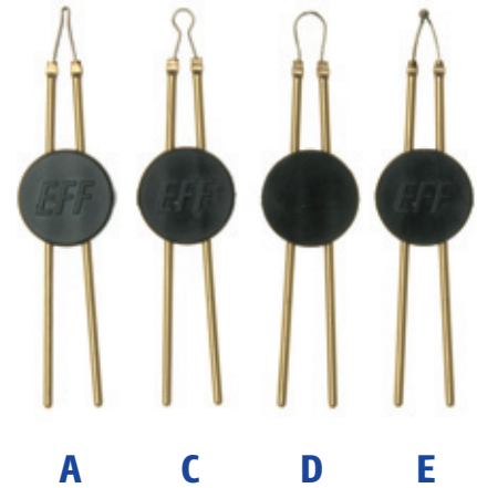
A C D E 09-201-D10 09-203-D10 09-204-D10 09-205-D10