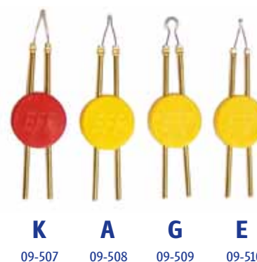
Fig. A, fine, ca. 30 mm Fig. L, fine, ca. 30 mm Fig. C, fine, ca. 30 mm Fig. P, fine, ca. 30 mm Fig. E, fine, ca. 30 mm Fig. K, medium, ca. 30 mm Fig. A, strong, ca. 30 mm Fig. G, strong, ca. 30 mm Fig. E, strong, ca. 30 mm on request: Fig. A, strong, ca. 115 mm Fig. E, strong, ca. 115 mm Fig. G, strong, ca. 115 mm Fig. K, strong, ca. 115 mm