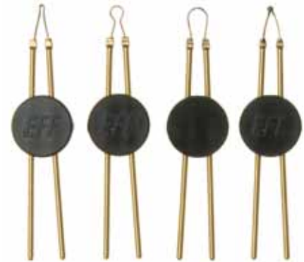
A C D E

09-201-D10 09-203-D10 09-204-D10 09-205-D10