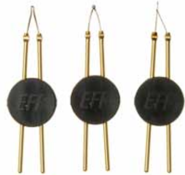
A E P

09-508-D10 09-510-D10 09-504-D10 09-501-D10 09-505-D10